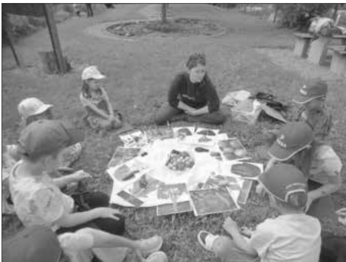
Beim Informationsprogramm „Bio-Logisch im Oberen Werntal“ erlernen Kinder spielerisch allerhand Wissen rund um die lokale Bio-Landwirtschaft

Das Projekt „Bio-Logisch im Oberen Werntal“ wird gefördert durch das Bundesministerium für Ernährung und Landwirtschaft aufgrund eines Beschlusses des Deutschen Bundestags im Rahmen des Bundesprogramm Ökologischer Landbau (BÖL). Neun Kommunen der Öko-Modellregion Oberes Werntal tragen den verbleibenden Anteil der Finanzierung.