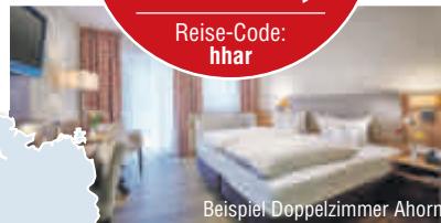
Beispiel Doppelzimmer Ahorn