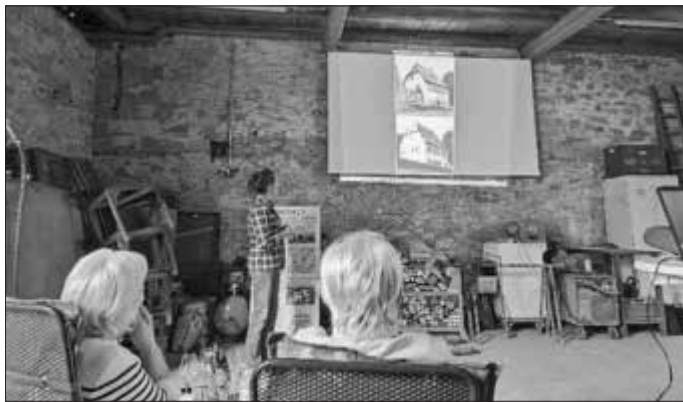
Zahlreiche vorher-nachher Bilder zeigten die Veränderungen des ehemaligen Forsthauses hin zum neuen „Wohntraum“.

Wer aus den ILE Gemeinden des Oberen Werntals ähnliches angehen möchte findet eine finanzielle und fachliche Unterstützung in dem Programm, das über das Amt für Ländliche Entwicklung sowie das Bayerische Landesamt für Denkmalpflege gefördert wird. Informationen hierzu unter www.oberes-werntal.de