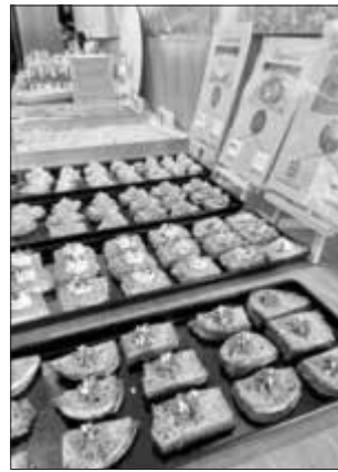
Viel reden macht hungrig und durstig! Beim ersten bio-regionalen Speeddating der unterfränkischen Öko-Modellregionen gab es viel Bio aus der Region

Geschäftig ging es zu am 17. Juni in der Aula des Amtes für Ernährung, Landwirtschaft und Forsten in Würzburg. Ganz nach dem Motto „Wissen wo's herkommt“ trafen sich dort zahlreiche Bio-Erzeugende, Handel und Küchen der Gemeinschaftsverpflegung. Denn die unterfränkischen Öko-Modellregionen Landkreis Aschaffenburg, Oberes Werntal, Rhön-Grabfeld und stadt.land.wü. hatten gemeinsam zum ersten Bio-regionalen Speeddating aufgerufen. An insgesamt 17 Tischen saßen Erzeugende mit ihren Produktproben und Infomaterial bereit, um über ihr Angebot zu informieren. Die gegenüberliegende Seite wurde von Vertreterinnen und Vertretern von Handelsunternehmen oder Küchen besetzt. Sobald ein Glockenläuten zu hören war, wurden die Gespräche eröffnet: In maximal 10minütigen Runden hieß es sich kennenlernen, vernetzen und austauschen.