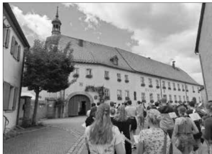
Die erste Marschprobe für den Oktoberfestumzug lief durch Geldersheim.

Eine zweite Marschprobe wird sich im September anschließen. Damit werden die Teilnehmer optimal vorbereitet sein, um den großen Auftritt in München zu genießen. Voraussichtlich wird der Umzug im Bayerischen Fernsehen übertragen, die ILE Gruppe wird mit Zug-Nummer 47 bei der live-Übertragung zu sehen sein.