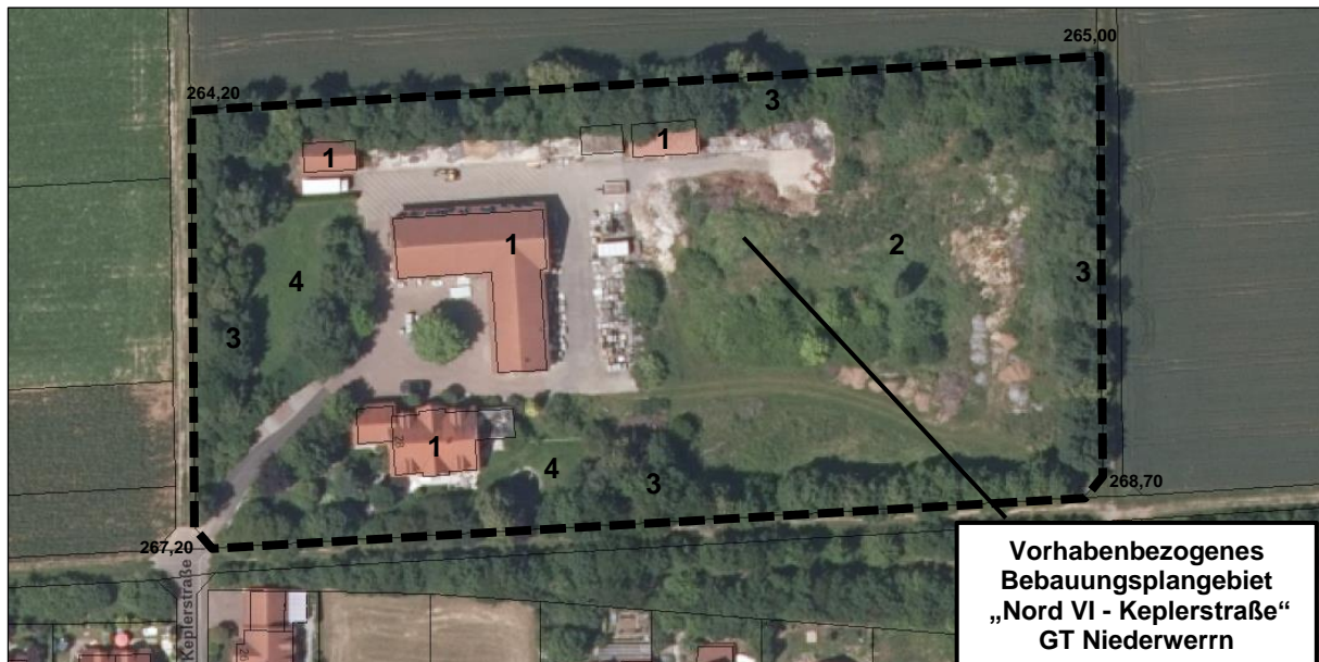
Abbildung 3: Aufgelassenes Betriebsgelände Fa. Elmar Schreier Garten- und Landschaftsbau GmbH & Co.KG, Bestand (01.2021)

Die als Betriebsgelände im engeren Sinn genutzten befestigten und überbauten Flächen sowie die unbefestigten Lagerflächen nehmen ca. 60,2 % des Areals der ehemaligen Elmar Schreier Garten- und Landschaftsbau GmbH und Co.KG ein. Diese Wirtschaftsflächen sind faktisch als bestehende überbebaute Flächen zu bezeichnen.