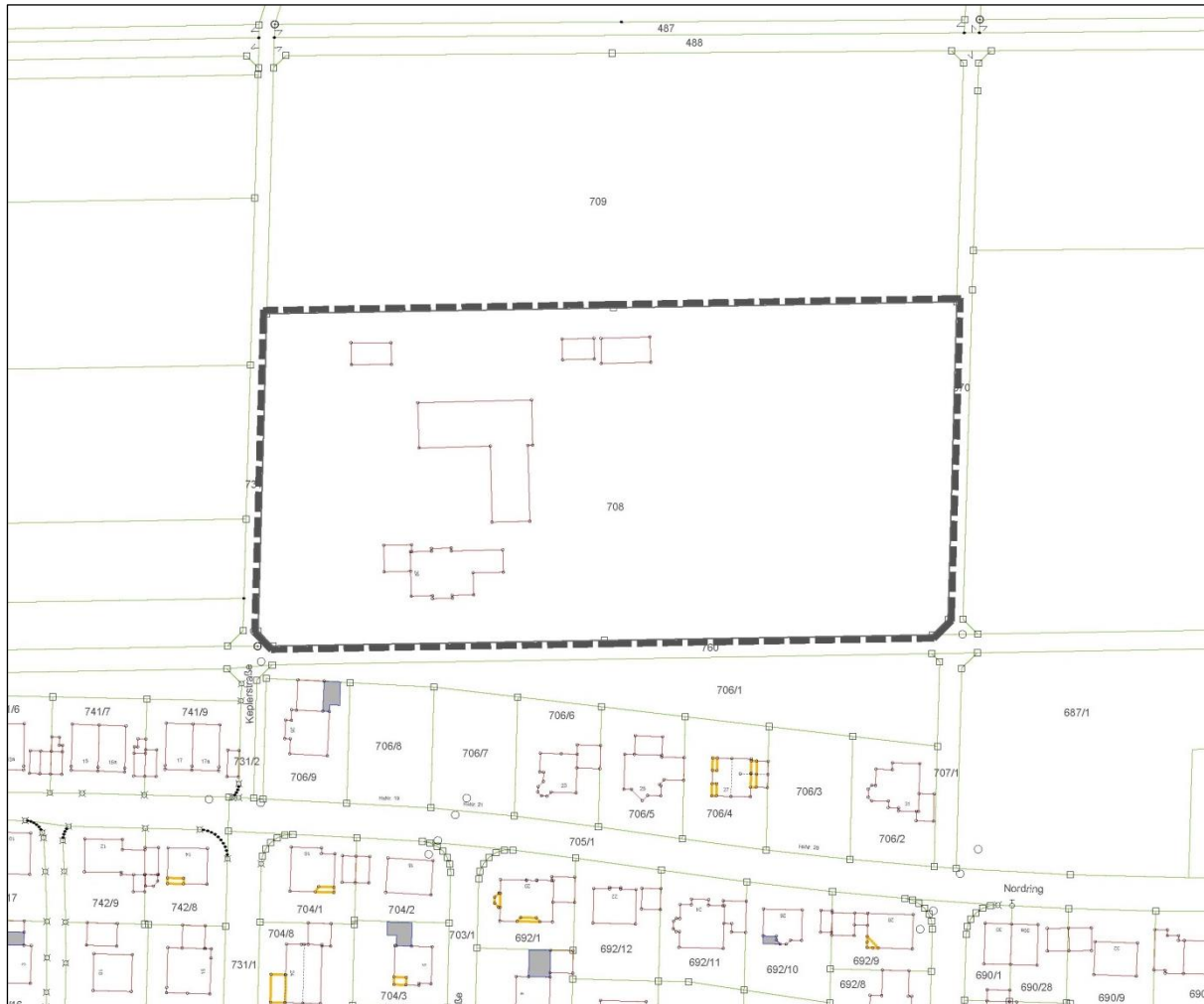
Abbildung 2: Geltungsbereich